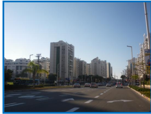
בנייה גבוהה של 13 קומות ומעלה. אין בנייה נמוכה