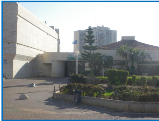
Photo No. 6.2.2 (b): Images of 10th Quarter (Rova Yod)