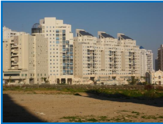
Photo No. 6.2.4 (b): Images of the Kirya Quarter