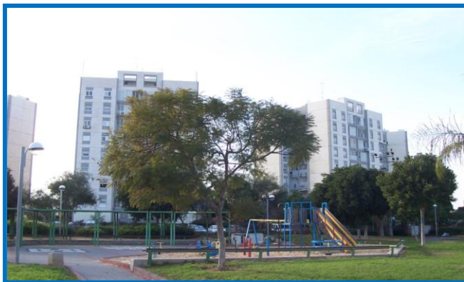
בנייה גבוהה של 9-12 קומות, במתחמים מסוימים.