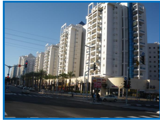
מרכז מסחרי עירוני. ברובע עצמו גינות משחק קטנות לאורך שבילי הליכה