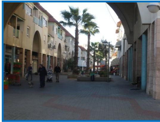
מדרכוב מסחרי במרכז הרובע ומתנ"ס רובע י'