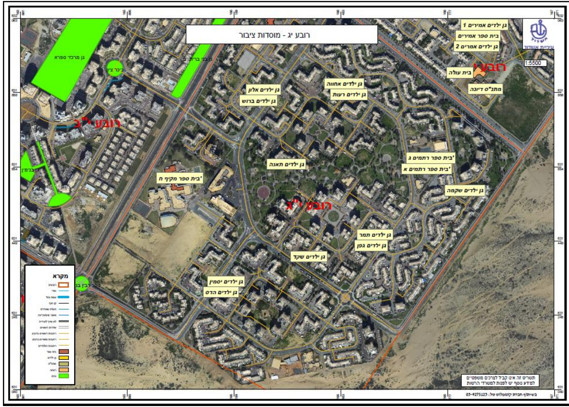
Photo No. 6.2.3 (a): 13th Quarter (Rova Yod – Gimel) - Distribution of public institutions