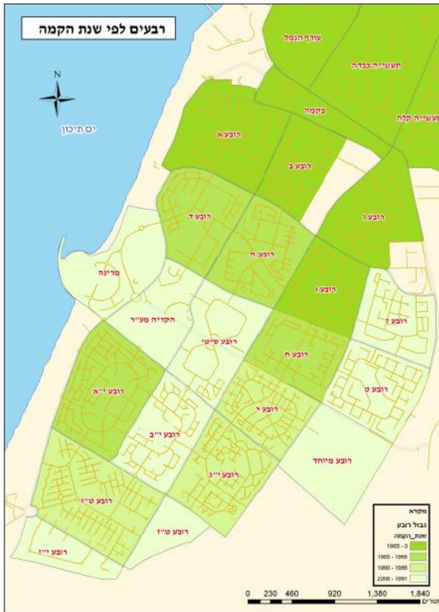
Map No. 6.1.3 (a): Urban Quarters in Ashdod by year of establishment