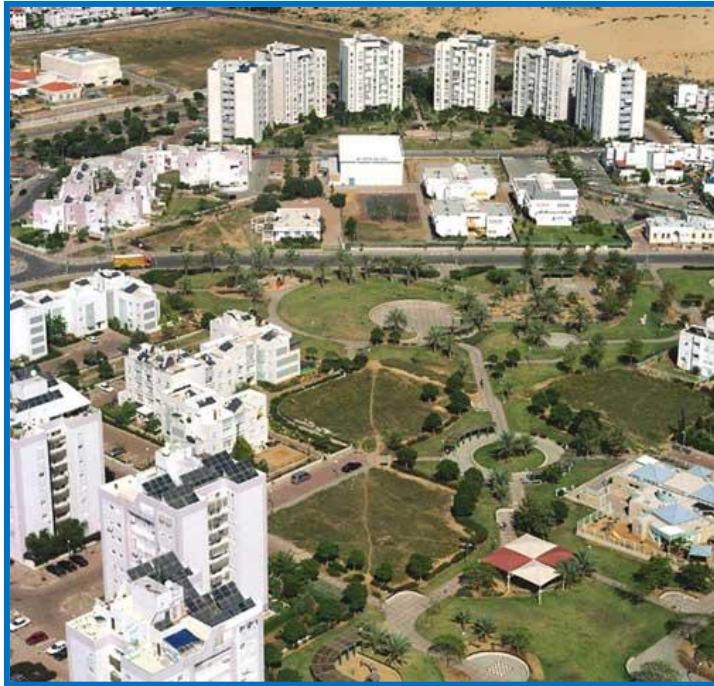
שצ"פ אלכסוני החוצה את הרובע, מורכב משתי גינות מרכזיות בשולי הרובע.