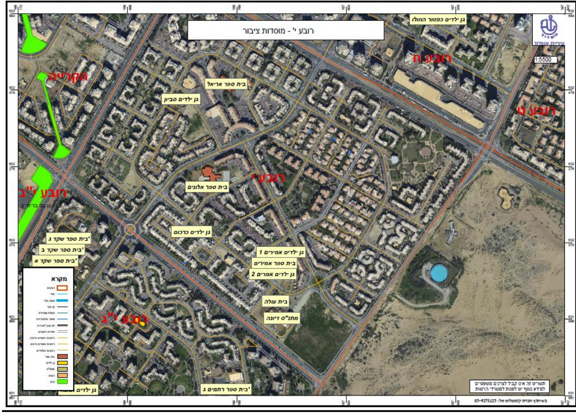
Photo No. 6.2.2 (a): 10th Quarter (Rova Yod) - Distribution of public institutions