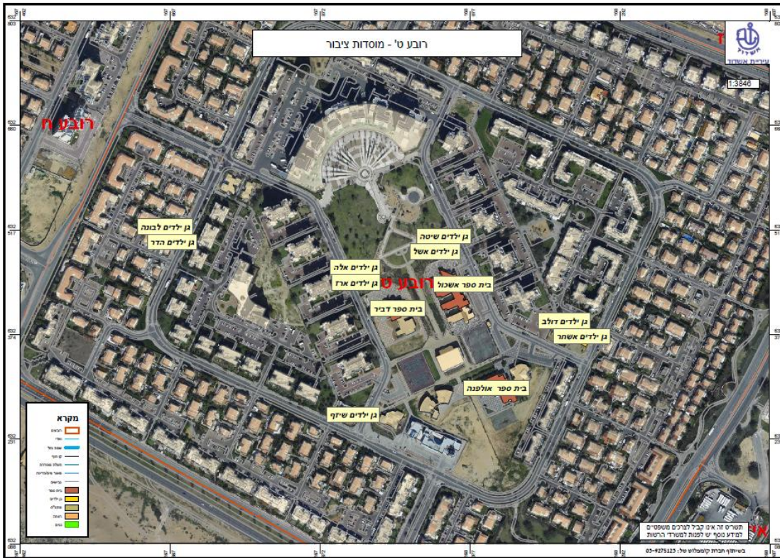
Photo No. 6.2.1 (a): 9th Quarter (Rova Tet) - Distribution of public Institutions and urban structure