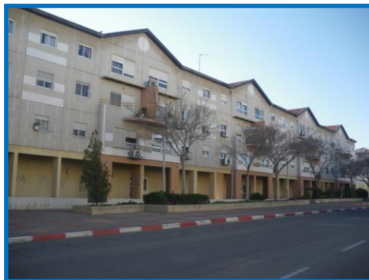
בניה נמוכה: 2-4 קומות, מתחמים של שיכונים: מספר כניסות בבניין אחד